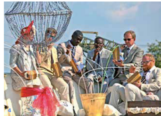
FORUM FÜR KUNST UND KULTUR E.V.