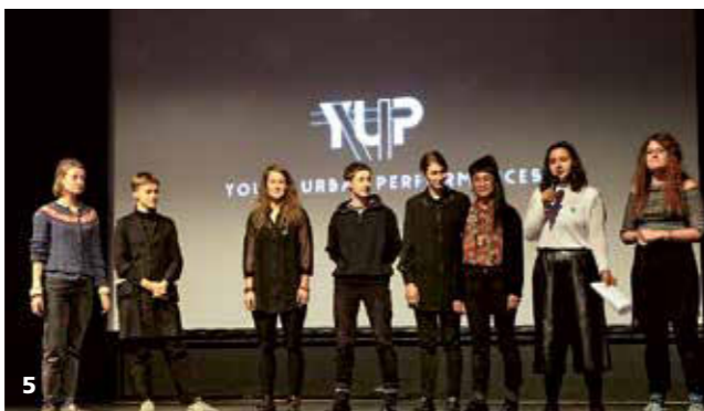
KOLLEKTIV YUP (YOUNG URBAN PERFORMANCES)